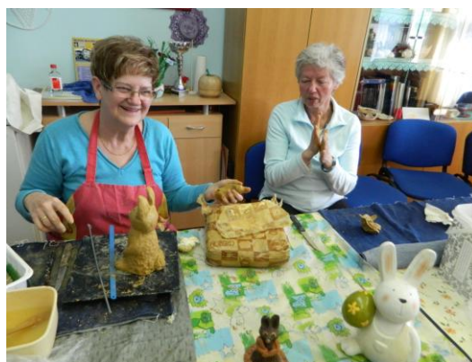
Ustvarjanje likovne sekcije