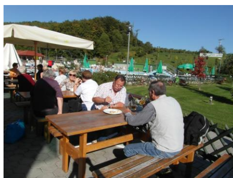
Pokušina prleške gibanice