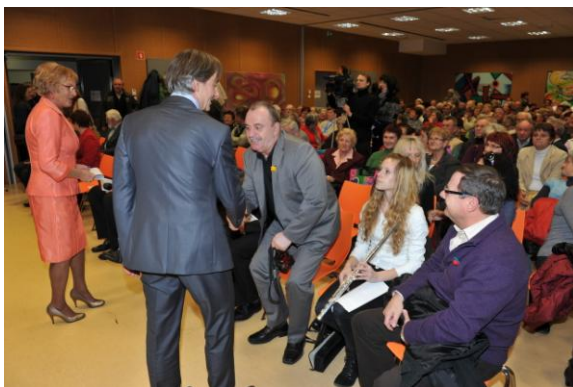
Regijska proslava v Slovenj Gradcu