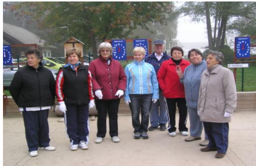
Na balinišču v Dravogradu