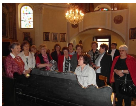
Pevke so zapele v brežiški cerkvi

V maju smo organizirali tudi romanje na Ptujsko Goro in junija na Brezje, kajti psihofizična sposobnost invalida je velikega pomena in temu dajemo tudi velik poudarek, saj se je tovrstnih romanj udeležilo največ članov in sicer 149.