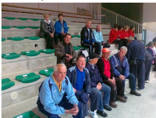
Balinanje v Kopru

V mesecu maju smo se udeležili prijateljskega tekmovanja v balinanju s pobratenim društvom Koper. Sodelovalo je osem članov.