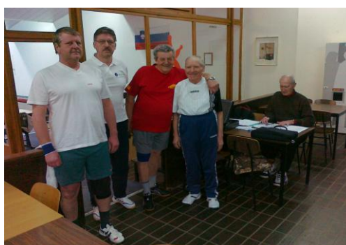
Moška ekipa v kegljanju

OT v balinanju – četvorke je bilo 19. 5. 2013 v Medobčinskem društvu invalidov Šaleške doline na Centralnem balinišču v Velenju. Tekmovanje je bilo teden dni po planu zaradi dežja, ker balinišče ni pokrito. Tekmovanja smo se udeležili z 10 člansko ekipo. V premočni konkurenci se nismo uvrstili med najboljše.