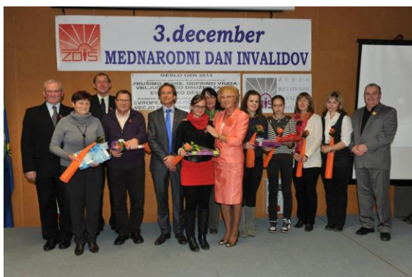
Mednarodni dan invalidov v Slovenj Gradcu

Proslavo ob tretjem decembru, Mednarodnemu dnevu invalidov, je tokrat organiziralo DI Slovenj Gradec, sami pa smo poimenovali ta dan kot DAN ODPRTIH VRAT.