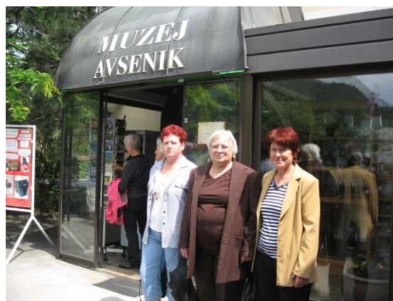
Brezje in Begunje

Junija smo organizirali pohod na Boč s 30 člani, pobrateno društvo iz Kopra pa je bilo organizator srečanja v Škocjanskih jamah.