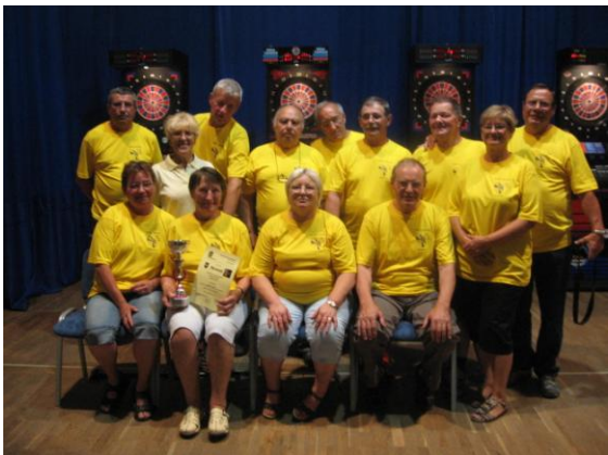
Občinski praznik - tekmovanje v pikadu

V okviru Občinskega praznika smo organizirali II. turnir v pikadu 6. 7. v domu ZB v Šentjanžu. Na turnirju se je med seboj pomerilo 6 moških in 6 ženskih ekip iz DI KR.