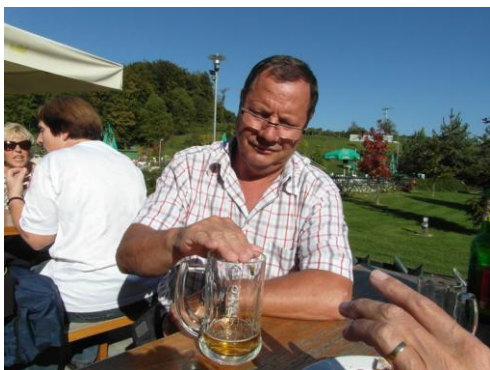
Tudi ose imajo rade pivo