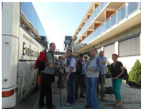
Pripravljani za pot proti domu