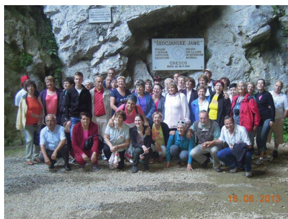
Škocjanske jame – 10. obletnica pobratenja z DI Koper

V juniju je 24 naših članov letovalo z agencijo Relax na Cipru. V mesecu avgustu smo se na povabilo DI Slovenj Gradec udeležili pohoda in druženja na Kopah. Vključili so se 104 člani.