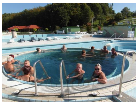
Veselo namakanje v vodi

Septembra je zopet čas za plavanje in tako smo šli ponovno v Bioterme v Malo Nedeljo. Udeležilo se je 50 članov.