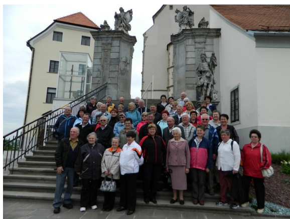
Romanje na Ptujsko Goro

V maju smo organizirali tudi romanje na Ptujsko Goro in junija na Brezje, kajti psihofizična sposobnost invalida je velikega pomena in temu dajemo tudi velik poudarek, saj se je tovrstnih romanj udeležilo največ članov in sicer 149.