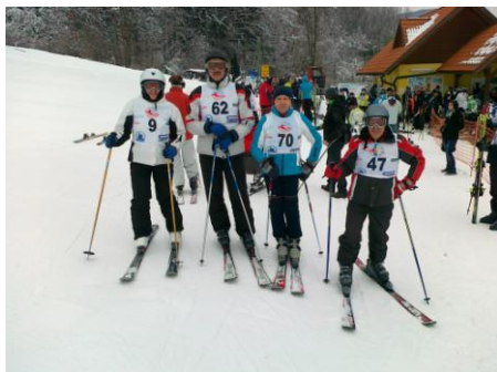
Tekmovanje v slalomu

Tako smo se udeležili DP v veleslalomu posamezno, ki ga je 9. 2. 2013 organiziralo Invalidsko športno društvo Samorastnik Ravne na Koroškem na smučišču Poseka. Iz našega društva so tekmovali 4 člani.