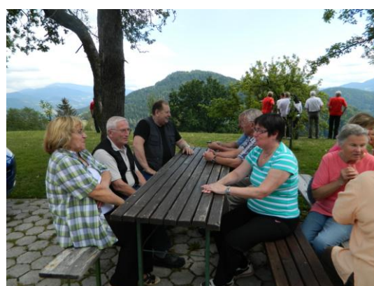
Piknik pri Lipovniku

Septembra je zopet čas za plavanje in tako smo šli ponovno v Bioterme v Malo Nedeljo. Udeležilo se je 50 članov.