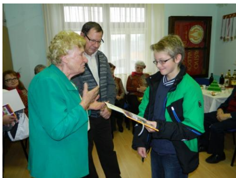
Dan odprtih vrat- podelitev priznanj učencem