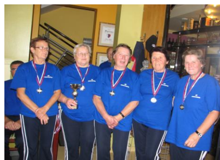
Zmagovalna ekipa v pikadu