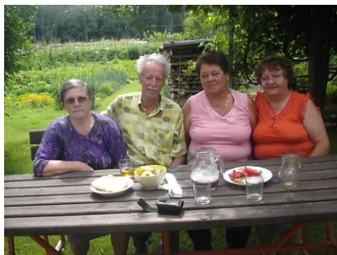
Člani socialne komisije s poverjeniki na obisku članov

Da pa težji invalidi in socialno šibki člani niso prikrajšani za kakšno bolj zahtevno turo izleta, smo jih v mesecu maju povabili na krajši in za njih primeren izlet v naravo – odpeljali so se na jez na Golico v Avstriji in Soboto ter se preko Radeljskega mejnega prehoda vrnili.