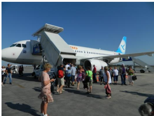
Z letalom in Relaxom na Ciper