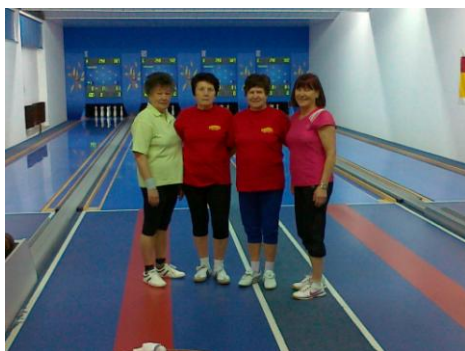
Ženska ekipa v kegljanju

6. 4. 2013 smo sodelovali na OT v kegljanju 120 lučajev posamezno. Organizator je bilo Invalidsko športno društvo Samorastnik Ravne na Koroškem. Naša udeležba je bila 9 članska.