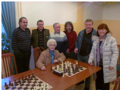
Uvrščeni na državno prvenstvo

16. 3. 2013 je bilo DP v hitropoteznem šahu posamezno, organizator Medobčinsko društvo invalidov Šaleške doline v gostišču pri Brigiti – Velenje.