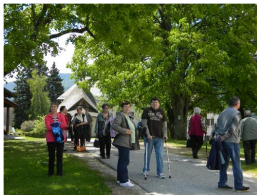
Izlet težjih invalidov – Golica v Avstriji

Piknik za te vrste invalidov smo priključili društvenemu pikniku, ki je bil organiziran pri Lipovniku. Ob izteku leta oziroma za Miklavževo je prejelo simbolno darilo okrog 55 članov, ki se preko celega leta niso udeležili srečanj iz kakršnih koli vzrokov (bolezni njih samih, svojcev, smrti v družini in podobno).