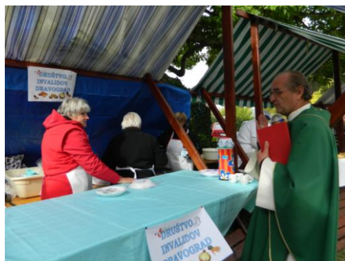
Župnik je »požegnal« naše kuharice

Seveda v novembru ne sme manjkati martinovanje, katerega smo imeli pri Lipovniku. Dobro novo vinsko letino je pokušalo 65 članov.