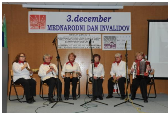
Nastop skupine Bica bend v Slovenj Gradcu

Mi smo mednarodni dan invalidov obeležili z dnevom odprtih vrat . Podelili smo priznanja učencem, ki so sodelovali v pedagoški akciji in pokazali občanom, kako smo skozi vse leto slikali, kiparili, kvačkali, predstavili smo zdravilna zelišča, napitke in kreme, uživali pa smo ob nastopu novoustanovljene društvene glasbene skupine Bica bend.