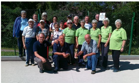
Baliranje v Mežici